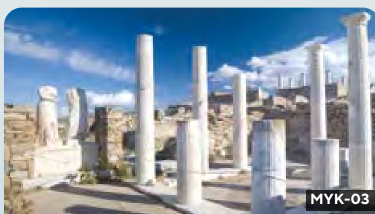
Míkonos - Delos: isla sagrada y santuario de Apolo