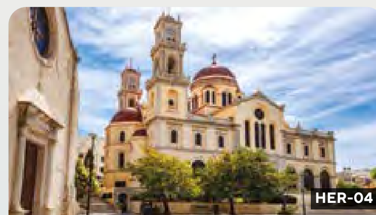
Heraclión - Experimente el estilo de vida cretense en el campo