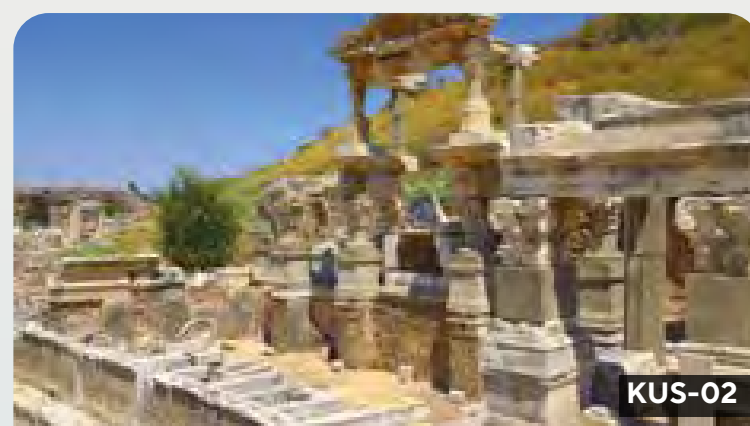
Kusadasi - La antigua Éfeso en tiempos de Grecia y Roma