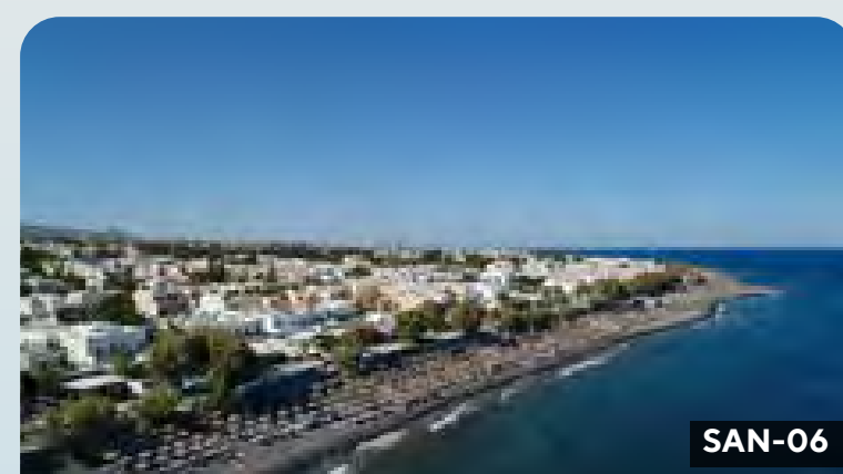
Santorini La esencia de Santorini