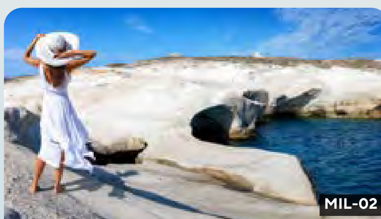
Milos Salto atrás en el tiempo