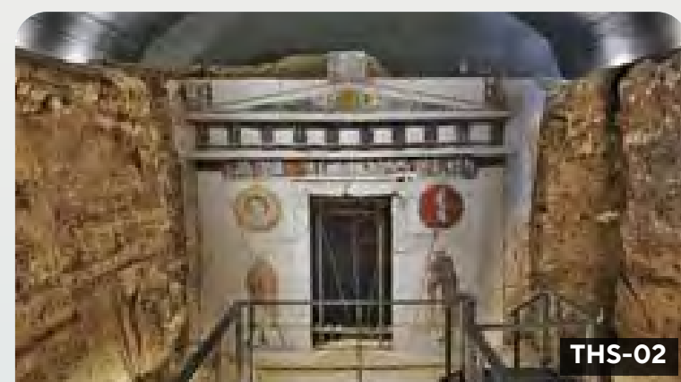
Salónica The Royal Tombs of Vergina